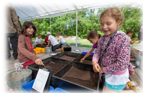
Studio du Ruisseau@smq, 2014

« Une animation du tonnerre, partout sur le site ! Viens vivre l'expérience archéologique avec de la simulation de fouilles et la visite d'un complexe archéologique vieux de 5 000 ans ! Viens expérimenter des outils et des techniques préhistoriques. Viens t'initier à la crosse et même rencontrer des paléontologues ! Pour vivre une sortie pleine de surprises, cet été, passe à Pointe-du-Buisson ! »