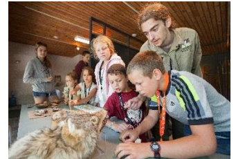
Studio du Ruisseau@smq, 2014

Aussi, l'équipe se spécialise en animation des groupes scolaires du 2 e cycle du primaire. En effet, le contenu de nos animations et de nos collections est directement en lien avec le cursus proposé aux élèves de 3 e et de 4 e année. Quelle magnifique expérience que celle de mettre en pratique ce qui est vu en classes !