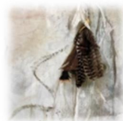
L'Éveil, acrylique sur toile, D. St-Georges

Lors de cette même journée, le musée a donné le coup d'envoi à une exposition des œuvres de l'artiste en arts visuels, Diane St-Georges, pour qui le mouvement est l'essence même de l'inspiration et qui dans cette micro-exposition laisse toute la place aux femmes autochtones disparues en supportant le mouvement Sister's in spirit .